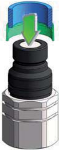
étape II step II