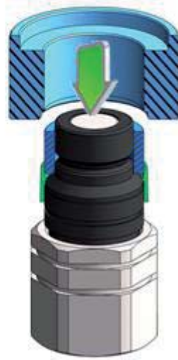
étape III step III