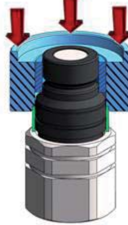
étape IV step IV