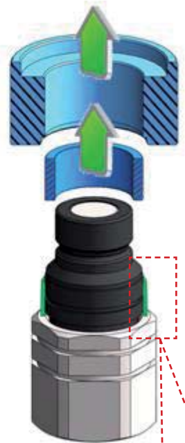
étape V step V

La bague couleur est parfaitement en place lorsqu'elle est en butée sur l'adaptateur du coupleur mâle