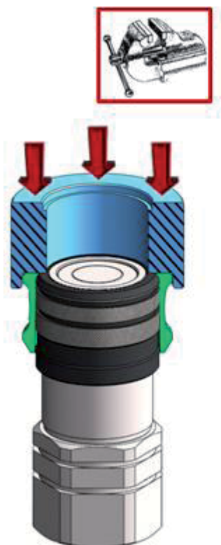
étape III step III