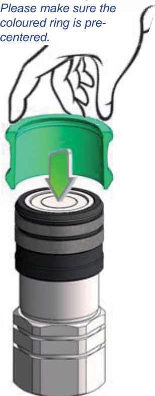
étape I step I

Assurez-vous de préciser la bague. Please make sure the coloured ring is pre- centered.