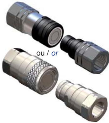
Coupleurs mâle/femelle FF, MLFF, FFCUP ou MLDB FF, MLFF, FFCUP or MLDB plug/socket set