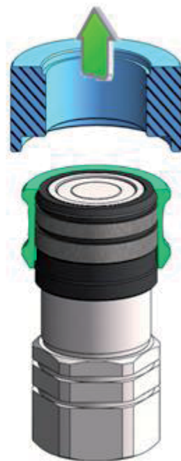
étape IV step IV

La bague couleur est bien en place lorsqu'elle est alignée avec la partie haute de la douille du coupleur femelle.