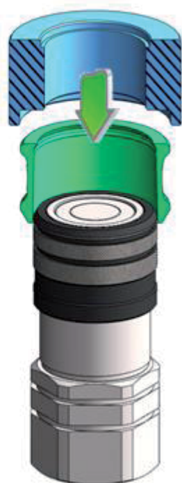
étape II step II