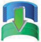
Outillage: anneau le plus petit Tool: smaller piece